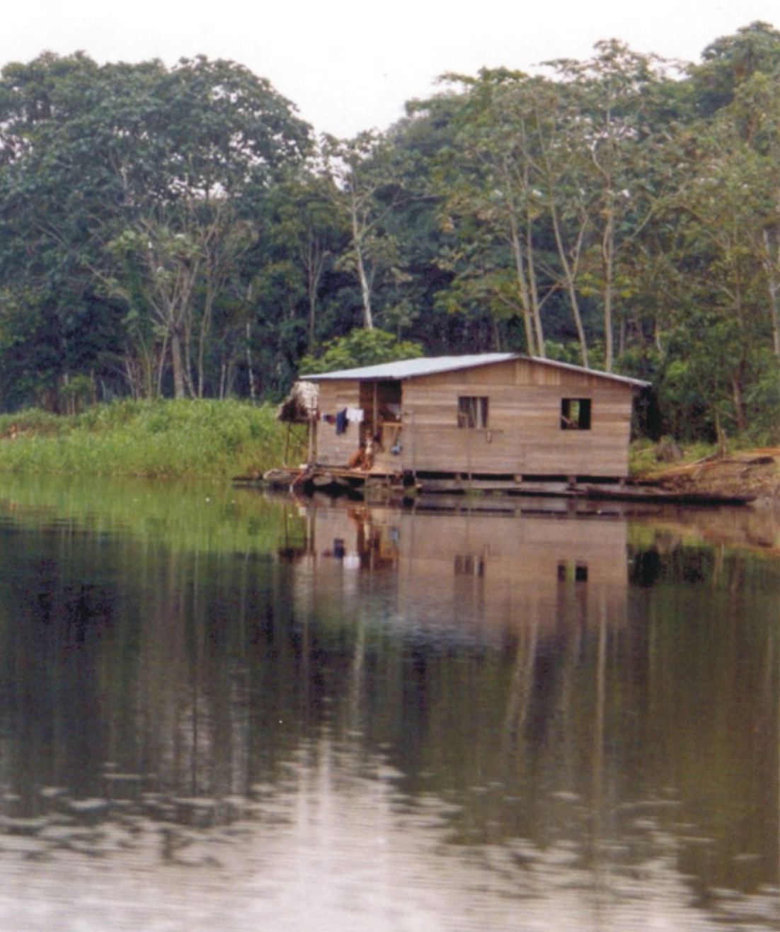
Comunidade ribeirinha da várzea do Paraná do Panauã, região do médio Solimões.

culturas ecológicas e produzem diferentes impactos ambientais, desafiando, deste modo, o consenso expresso no Relatório Brundtland, na Eco 92 e em publicações oficiais, de que pobreza e degradação ambiental estejam necessária e intimamente relacionadas (cf. Cima, 1991). Relatórios oficiais mais recentes (como Forsyth, Leach e Scoones, 1998), apresentam novas reflexões sobre a relação entre pobreza e meio ambiente. Como estas não são categorias homogêneas, é preciso identificar, segundo esses relatórios, o contexto que leva segmentos pobres a degradarem o ambiente: geralmente por falta de opções econômicas para sua sobrevivência imediata. Mas nem na Amazônia nem em outras regiões se concede igual atenção à relação entre riqueza e meio ambiente. Dentre as categorias socio-