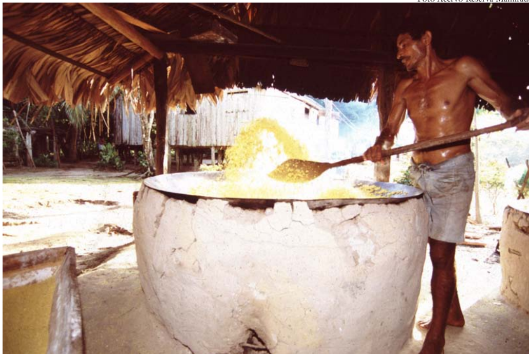
Ribeirinho fazendo farinha: sistema de pequenos produtores tradicionais.