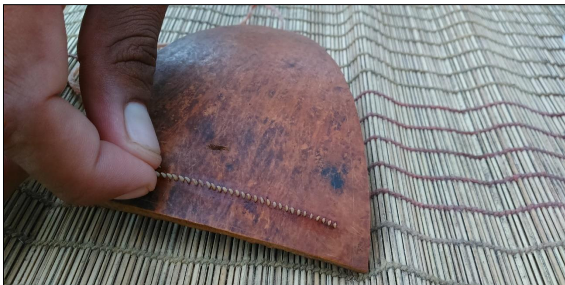
Figura 8 – Ajustando as pontas da arranhadeira

É preciso bastante equilíbrio ao ajustar as pontas da arranhadeira, do contrário sua utilização pode ser muito dolorida. Para fazer de forma correta, segundo a cultura, é importante que os homens, que têm a habilidade de fazê-lo, testem na hora do término de sua confecção. Esse trabalho pode ser feito em casa ou no centro da aldeia, junto com outros homens.