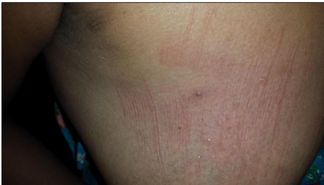
Figura 3 – Resultado da arranhadeira

As arranhadeiras são utilizadas não apenas para curar as doenças físicas, mas também as doenças espirituais. Há regras de uso da arranhadeira de forma correta, utilizada para curar a doença do espírito. Até hoje, a arranhadeira é utilizada por raizeiros e é usada para salvar a vida da pessoa.