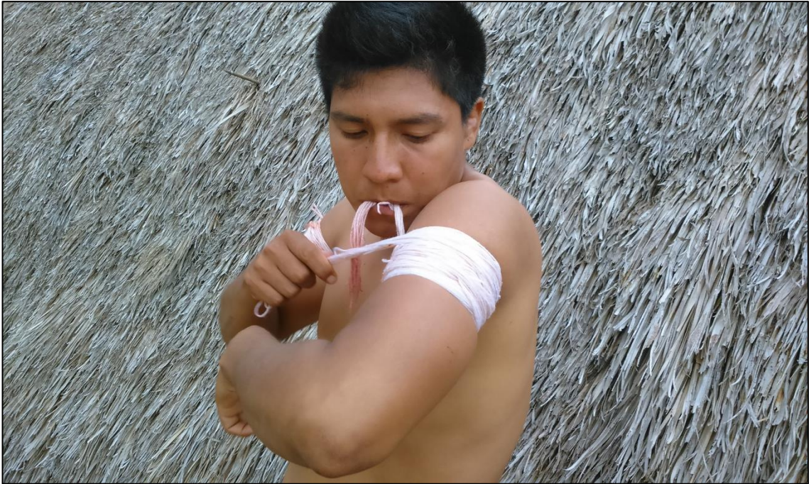
Figura 12 – Usando enfeite para o braço ficar grosso