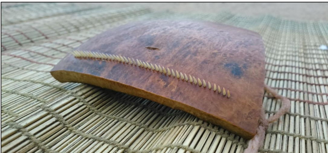
Figura 7 – Detalhe da arranhadeira