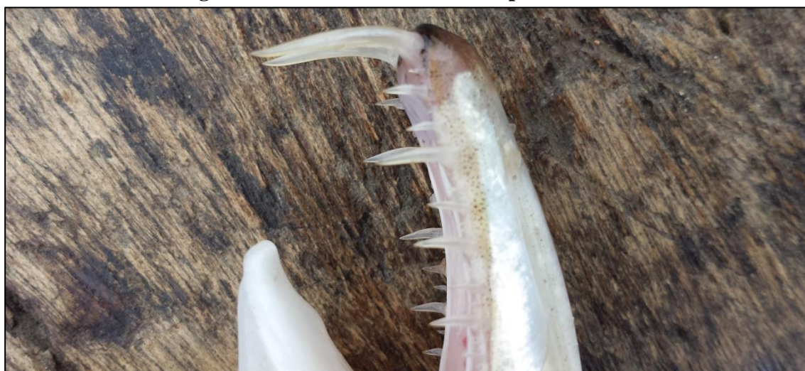
Figura 5 – Detalhes dos dentes do peixe Cachorra

Esses dentes, os mais velhos retiram para fixar em um pedaço triangular de cabaça que é envolto em um barbante que por sua vez é fixado com cera da abelha. Depois de pronta, a arranhadeira é utilizada para arranhar os braços, usa-se remédio do mato para passar depois.