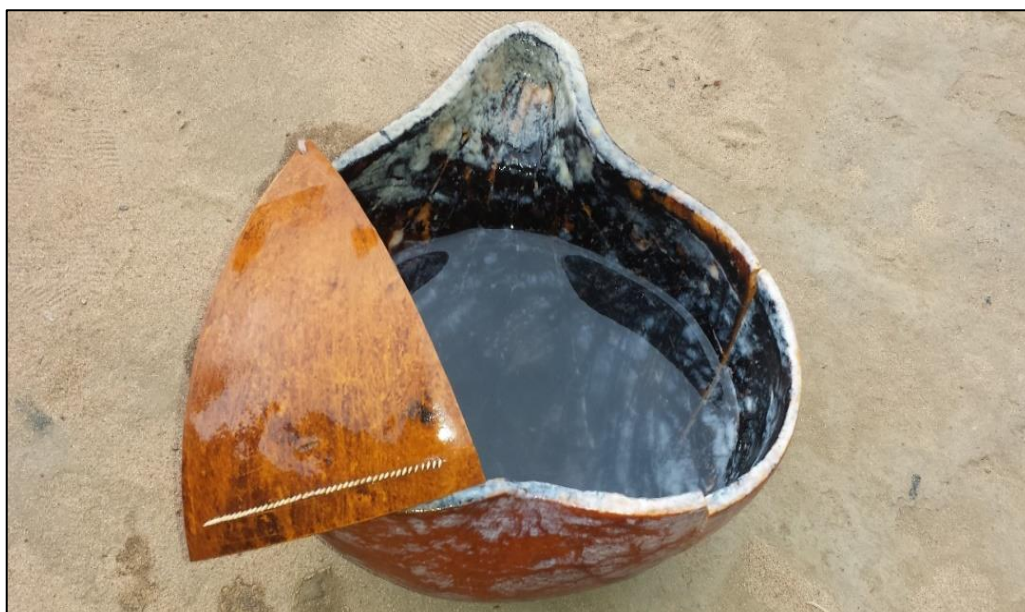
Figura 9 – Preparando a arranhadeira