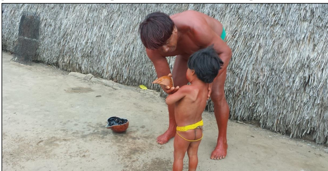
Figura 13 – A arranhadeira para Kamaiurá também é usada para educar a criança