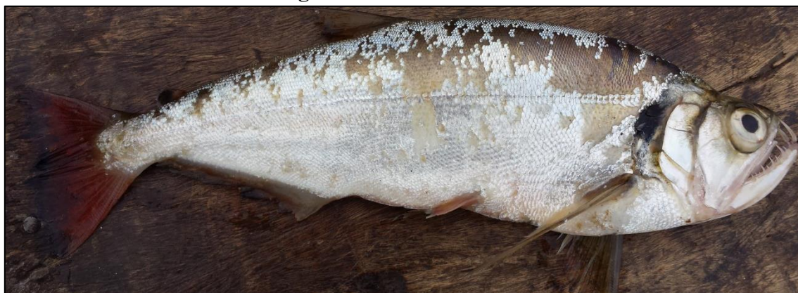
Figura 4 – Peixe Cachorra

uns vinte peixes para a confecção da arranhadeira. Retiram os dentes inteiros e os levam ao sol para secar a carne e poder retirar com mais facilidade os dentes depois.